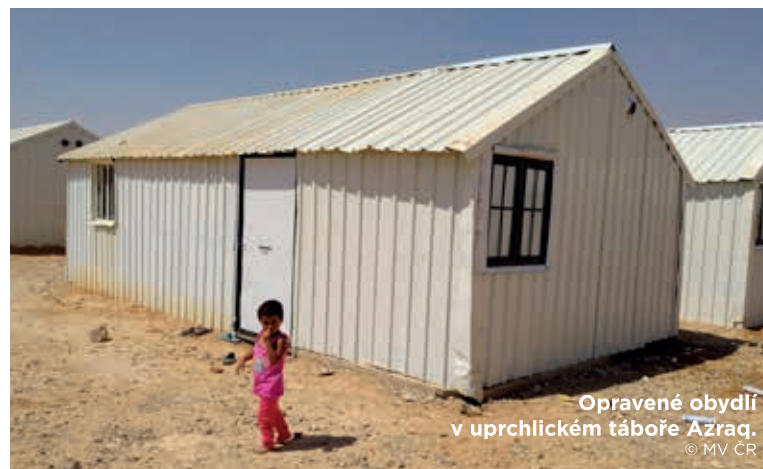
Opravené obydlí v uprchlickém táboře Azraq.