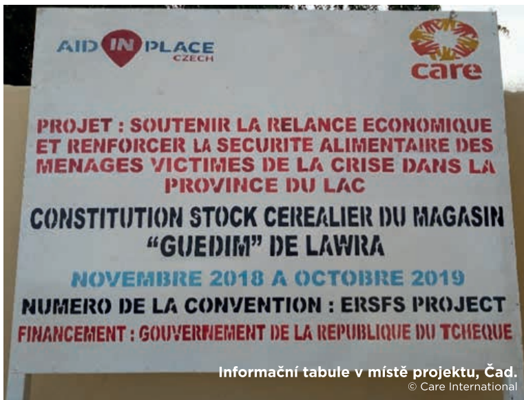
Informační tabule v místě projektu, Čad.