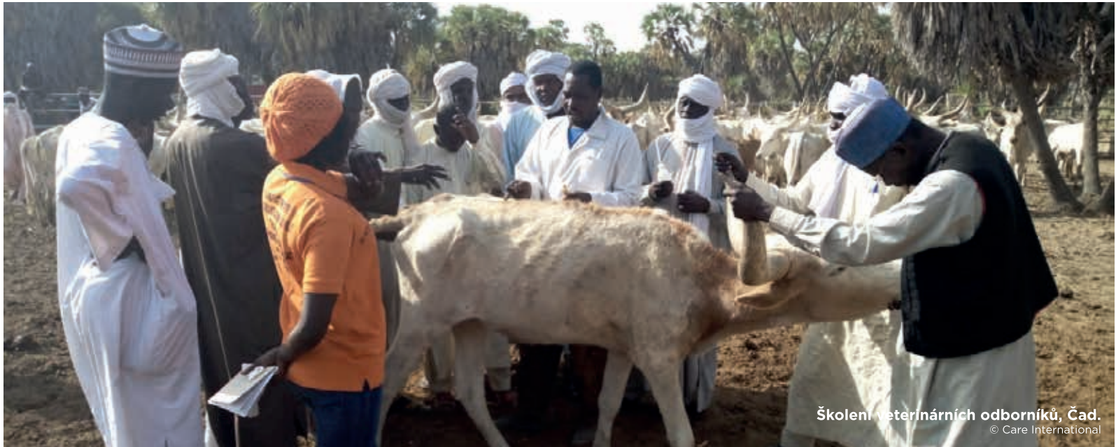
Školení veterinárních odborníků, Čad.