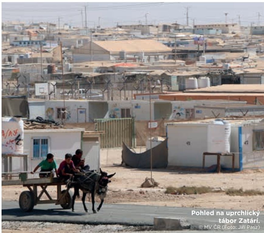
Pohled na uprchlický tábor Zaatari.