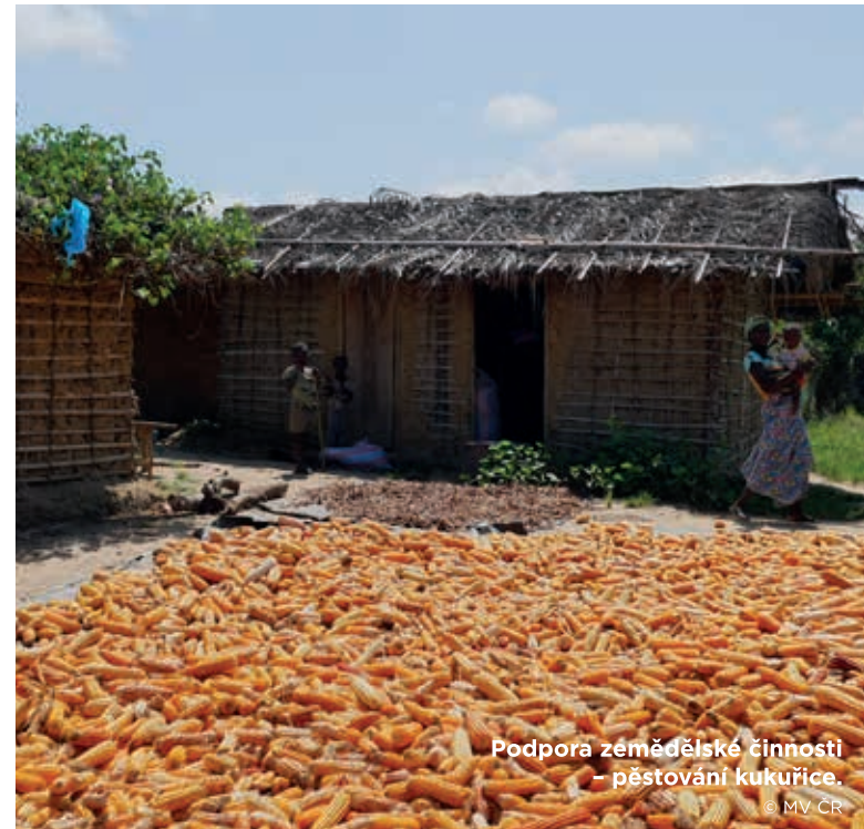
Podpora zemědělské činnosti – pěstování kukuřice.