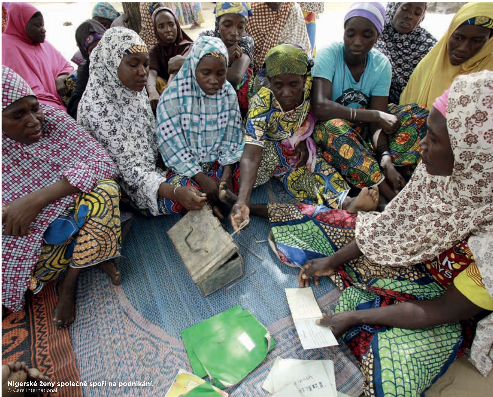
Nigerské ženy společně spoří na podnikání.