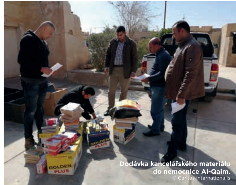
Dodávka kancelářského materiálu do nemocnice Al-Qaim.

V první polovině 2019 proběhlo výběrové řízení na dodavatele veškerého zdravotnického vybavení. V březnu 2019 pak byl vyškolen nemocniční personál v oblasti statistického výkaznictví a v používání počítačových programů. Projekt též vybavil kancelář nemocnice novými počítači, tiskárnou, nábytkem a spotřebním kancelářským materiálem. Realizace projektu bude ukončena v květnu 2019.