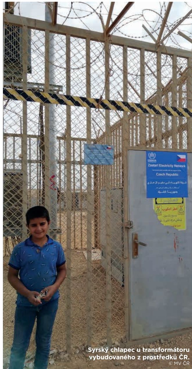
Syrský chlapec u transformátoru vybudovaného z prostředků ČR.