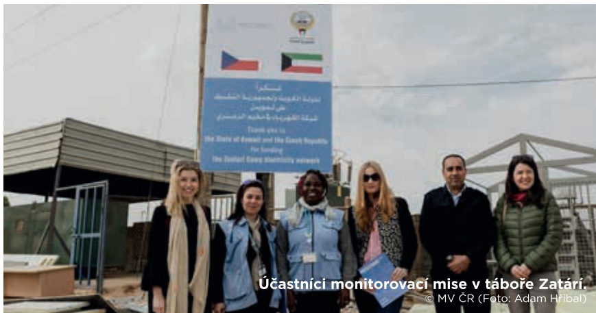
Účastníci monitorovací mise v táboře Zaatari.