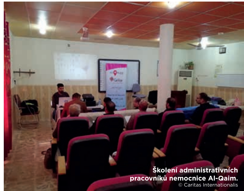
Školení administrativních pracovníků nemocnice Al-Qaim.