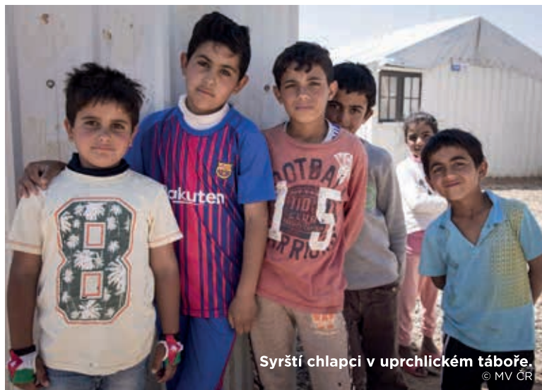
Syrští chlapci v uprchlickém táboře.