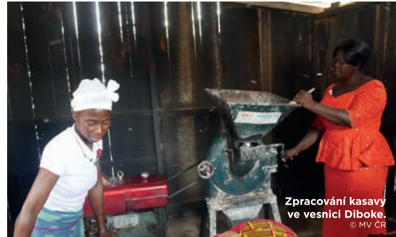
Zpracování kasavy ve vesnici Diboke.

Ministerstvo vnitra pravidelně provádí průběžný monitoring všech projektů programu Pomoc na místě. Implementační partneři Ministerstvu vnitra předkládají průběžné a závěrečné zprávy z realizace projektů včetně přehledu čerpání rozpočtu. Koordinátoři programu Pomoc na místě též provádějí podrobný monitoring aktivit a výstupů jednotlivých projektů přímo v místě realizace, a to ve spolupráci s příslušnými zastupitelskými úřady České republiky v dané zemi. ♥