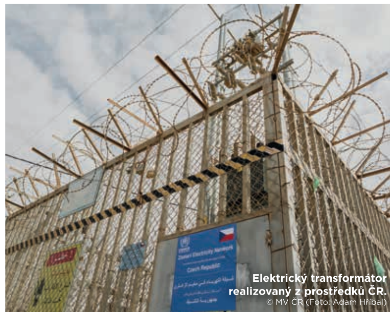
Elektrický transformátor realizovaný z prostředků ČR.