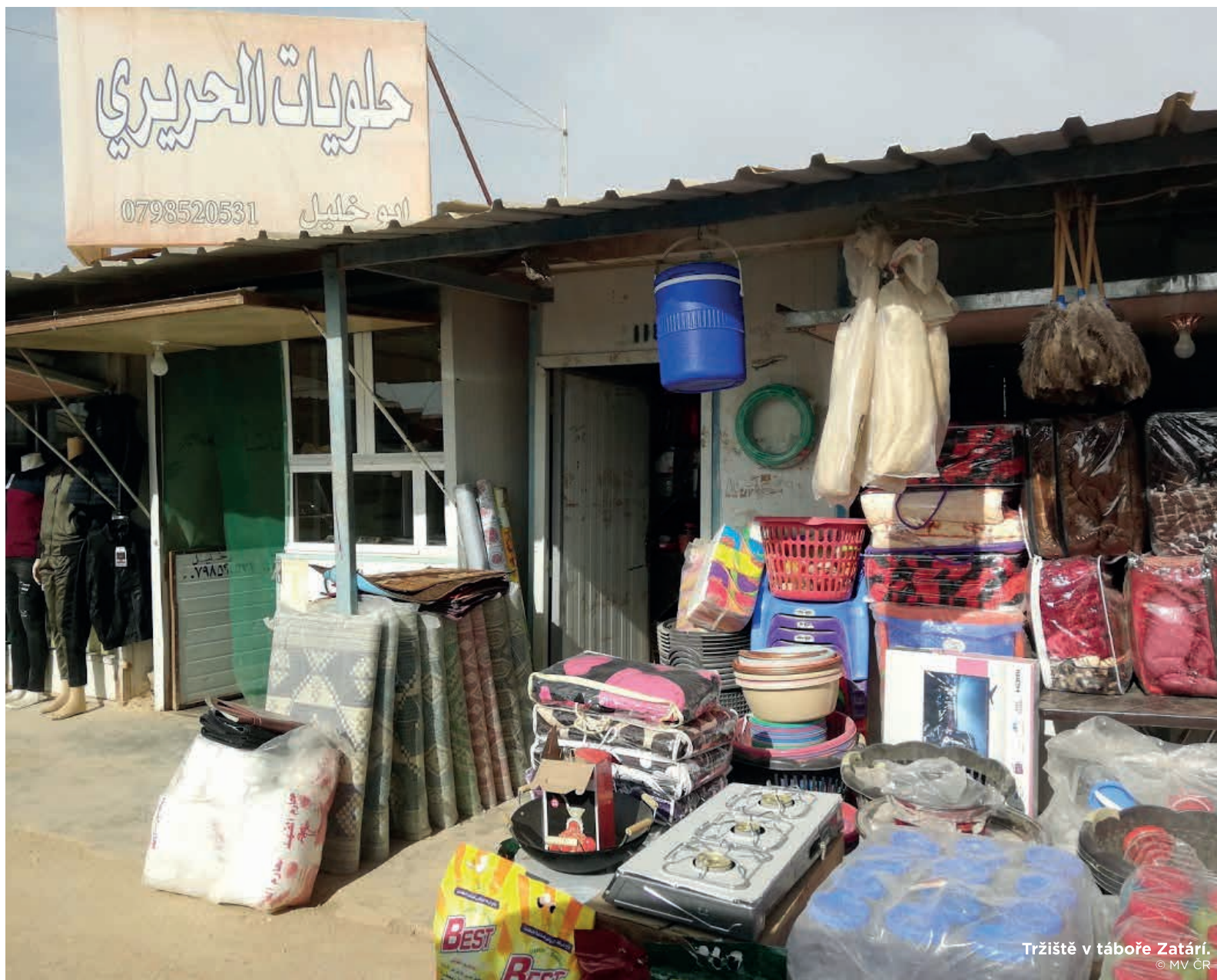
Tržiště v táboře Zatáří.