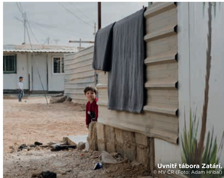
Uvnitř tábora Zatári. © MV ČR (Foto: Adam Hříbal)

Implementačním partnerem projektu byl UNHCR.