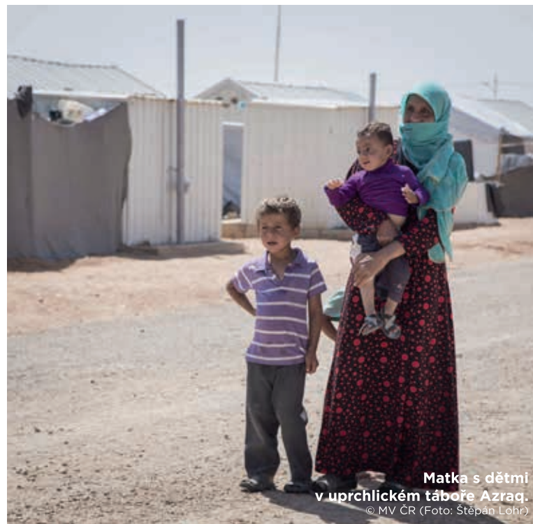
Matka s dětmi v uprchlickém táboře Azraq.

Realizace projektu byla ukončena v prosinci 2018. Výstupy byly dosaženy v plném rozsahu.