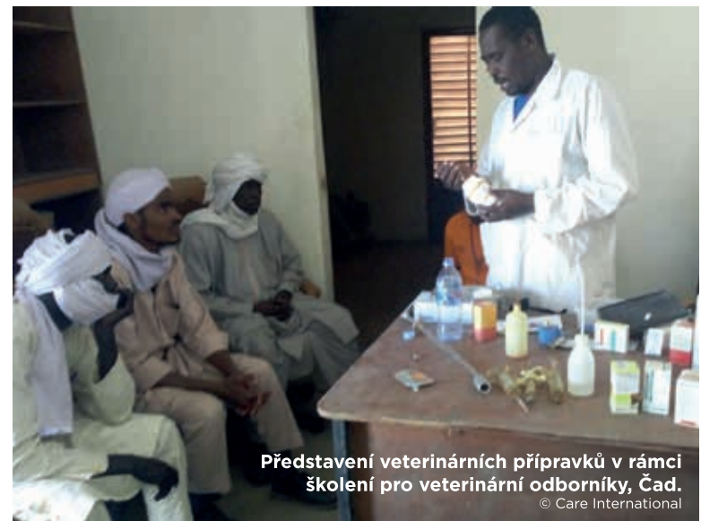
Představení veterinárních přípravků v rámci školení pro veterinární odborníky, Čad.